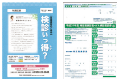
冊子「各種検診のご案内」 受診券