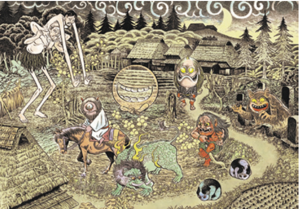
妖怪のとき・暗闇の世界(左) 雪姫ちゃんとゲゲゲの鬼太郎(鬼妖怪屏絵) 1985年(右)