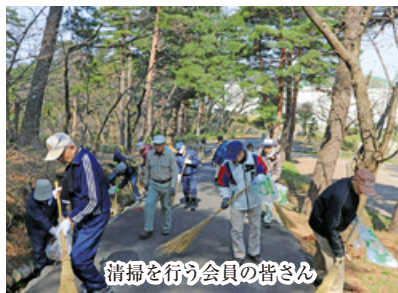
清掃を行う会員の皆さん