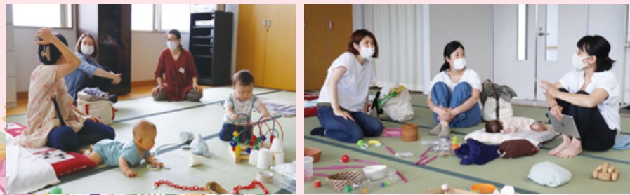
子どもたちも遊びに夢中!!