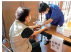
血糖値を測定し、4週間自宅で取り組むチャレンジ目標を設定。