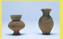
古津八幡山遺跡出土土器(左:北陸系・右:東北南部系)

北陸地方の土器、東北南部(会津)方面の土器、さらにはそれらの折衷土器の3系統の土器が出土しています。そのほか、秋田県などの東北北部や、長野県の土器も少量出土しています。現在、新津駅は鉄道網の要ですが、はるか昔弥生時代にも、すでにこの場所が北陸や会津など、各地域を結ぶ交通の要衝に位置していたことがわかります。