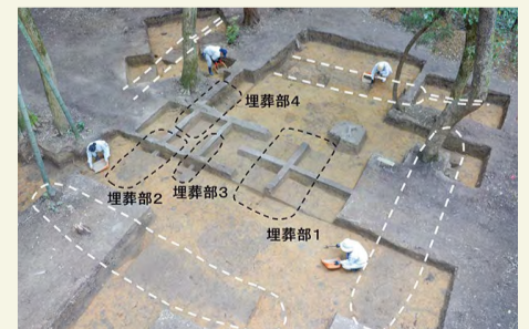
大型の方形周溝墓

一辺約10mの大型の方形周溝墓という四角いお墓が見つかり、内部に4つの埋葬施設を持つことが判明しました。県内における弥生時代のお墓としては初の複数埋葬の事例として注目されています。また、その4つの埋葬施設のうちの1つは板材で囲った空間に棺を納める「木槨」と考えられ、これまで東日本の墓では確認されておらず、西日本でも当時の最上位の埋葬形式であることから、西日本の有力な首長とのつながりによって古津八幡山遺跡へ入ってきたと推測されます。