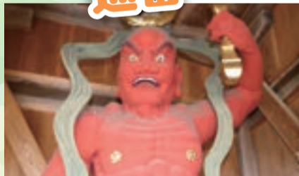
金剛力士像(小口神明宮観音堂)

11月10日、秋葉区と新潟市スポーツ推進委員連盟秋葉区協議会による秋葉区健康ウォーキングが開催されました。参加者が巡った史跡やスポットを紹介します。小口の歴史を学び、皆さんも出掛けてみませんか。