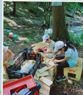
大工コーナー (工作)