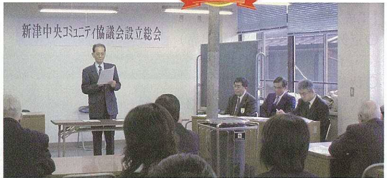
新津中央コミュニティ協議会設立総会 H19.3.11 本町二番館