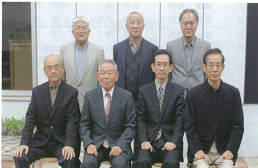
【現、正副会長・事務局】