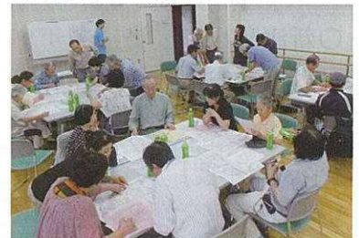
現在の活動の様子