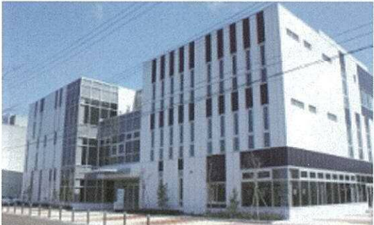
現在、事務局の入っている新津地域交流センター