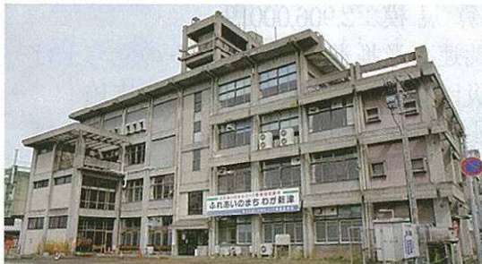
創設から3年間、コミ協事務局のあった本町二番館