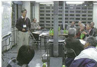
本町二番館当時の活動の様子