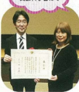
長谷川 山口 地域教育 校長先生 コーディネーター