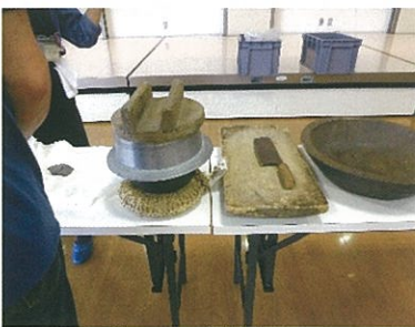
昔の釜・水筒など