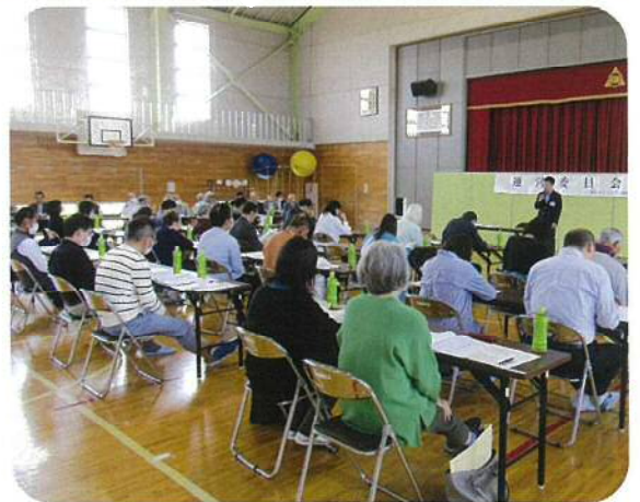
5月運営委員会総会の様子

そのために、若い世代・女性・高齢者などいろいろな考えをお持ちの人の参画が必要不可欠です。前例踏襲ではなく、協議会の原点に立ち返って、目的実現のためには何をどうすべきかを意見を出し合ってすすめていきたいと考えています。回覧板等で行事の開催についてお知らせしますので、まずは、コミ協の行事に気軽に参加してみてください。そして、次回のためにご意見をお願いします。皆さんとともに、よりよいふるさとを作っていきます。