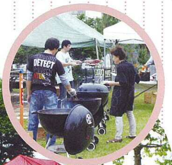
公園バーベキュー