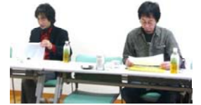
編曲のオトノハコさんとの打合せ

ご当地ソング完成に際して、新潟日報社から取材を受け、2月9日の朝刊に載りました。また、ラジオ「FMにいつ」でも紹介されました。今後時々「FMにいつ」にて曲が流れますのでお聞きください。