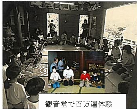
観音堂で百万遍体験