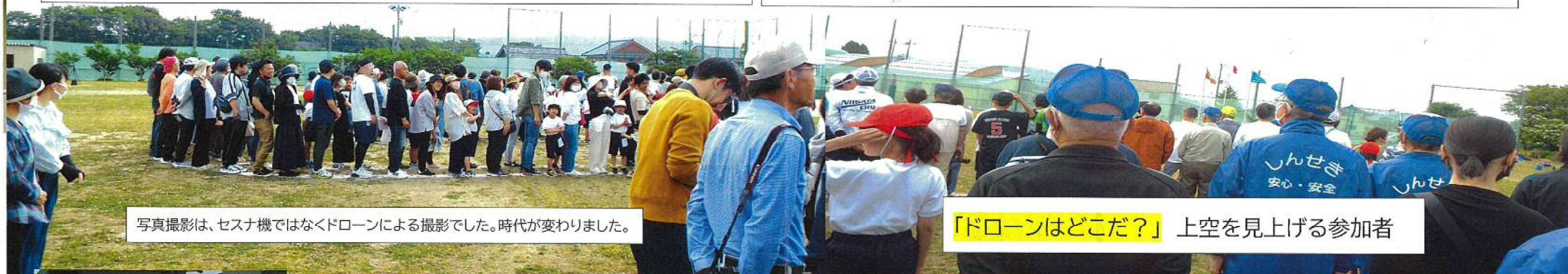
写真撮影は、セスナ機ではなくドローンによる撮影でした。時代が変わりました。

運動会のプログラム最初の地域種目として、航空写真撮影による「 人文字づくり 」から始まりました。新関小学校誕生「150歳」を記念した「 150人の人文字 」です。児童や職員、保護者だけでなく広く地域住民などに参加を呼びかけたところ、 300人を超える地域の方々 (中学生や卒業生も)が参加していただきました。