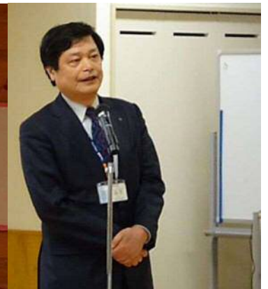
羽生秋葉区長様のご祝辞