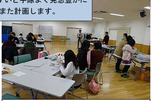
3月12日：新関コミ協・新津地区公民館・新関小との共催事業として行いました。