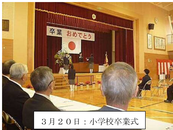
3月20日：小学校卒業式