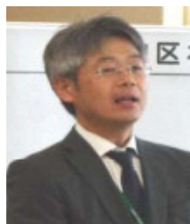
池田社会福祉協議会事務局長補佐様