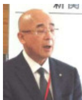
谷澤新関郵便局長様