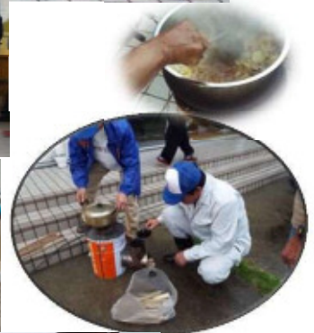
投光器の灯りを頼りに炊き出し訓練