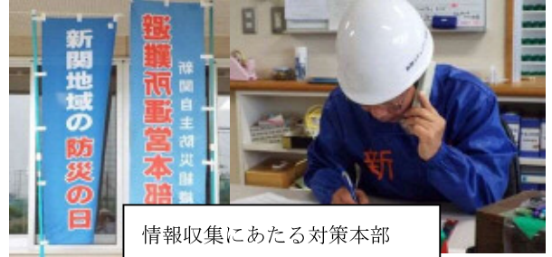
情報収集にあたる対策本部