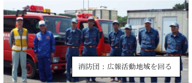
消防団：広報活動地域を回る

災害時には必ずと言ってよいほど停電が伴います。防災訓練時はもちろん定期的にエンジン起動し、もしもの時に備えておきます。