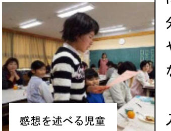
感想を述べる児童

不思議とクリスマスツッキング教室の日は晴天に恵まれます。新関小学校3階の家庭科室には日差しがいっぱい。参加児童はいたって気分爽快。いつもながら食生活改善推進委員さんやボランティアさんやおうちの方から教わりながらの調理に挑戦。