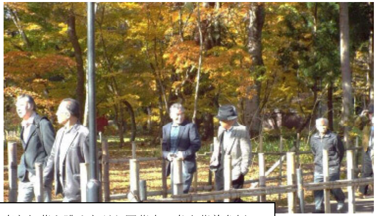
見事な紅葉を眺めながら圓蔵寺・虚空蔵尊参拝