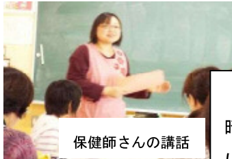
保健師さんの講話