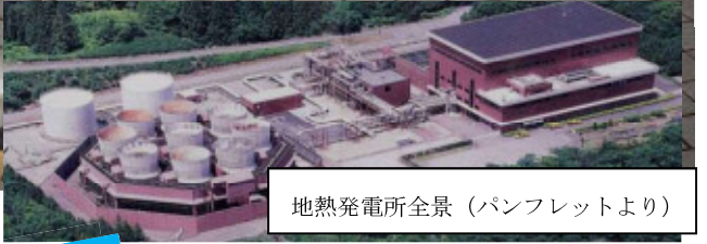
地熱発電所全景 (パンフレットより)