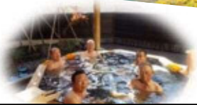
秋の日差しいっぱい真昼の露天風呂 極楽、極楽！