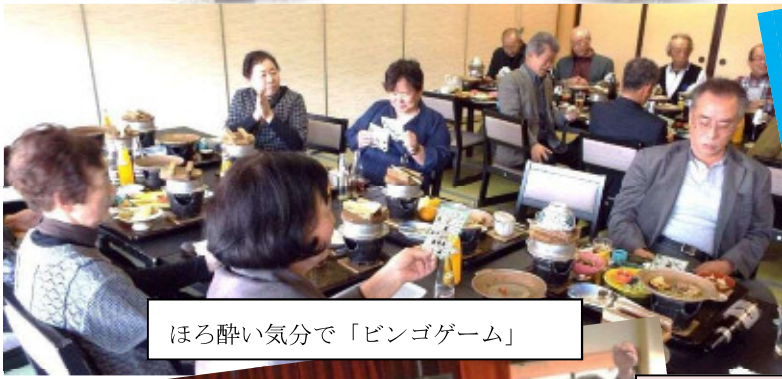
ほろ酔い気分で「ビンゴゲーム」