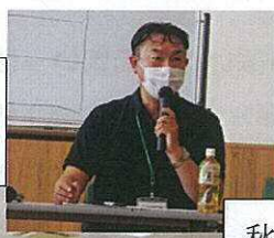
秋葉区社会福祉協議会様