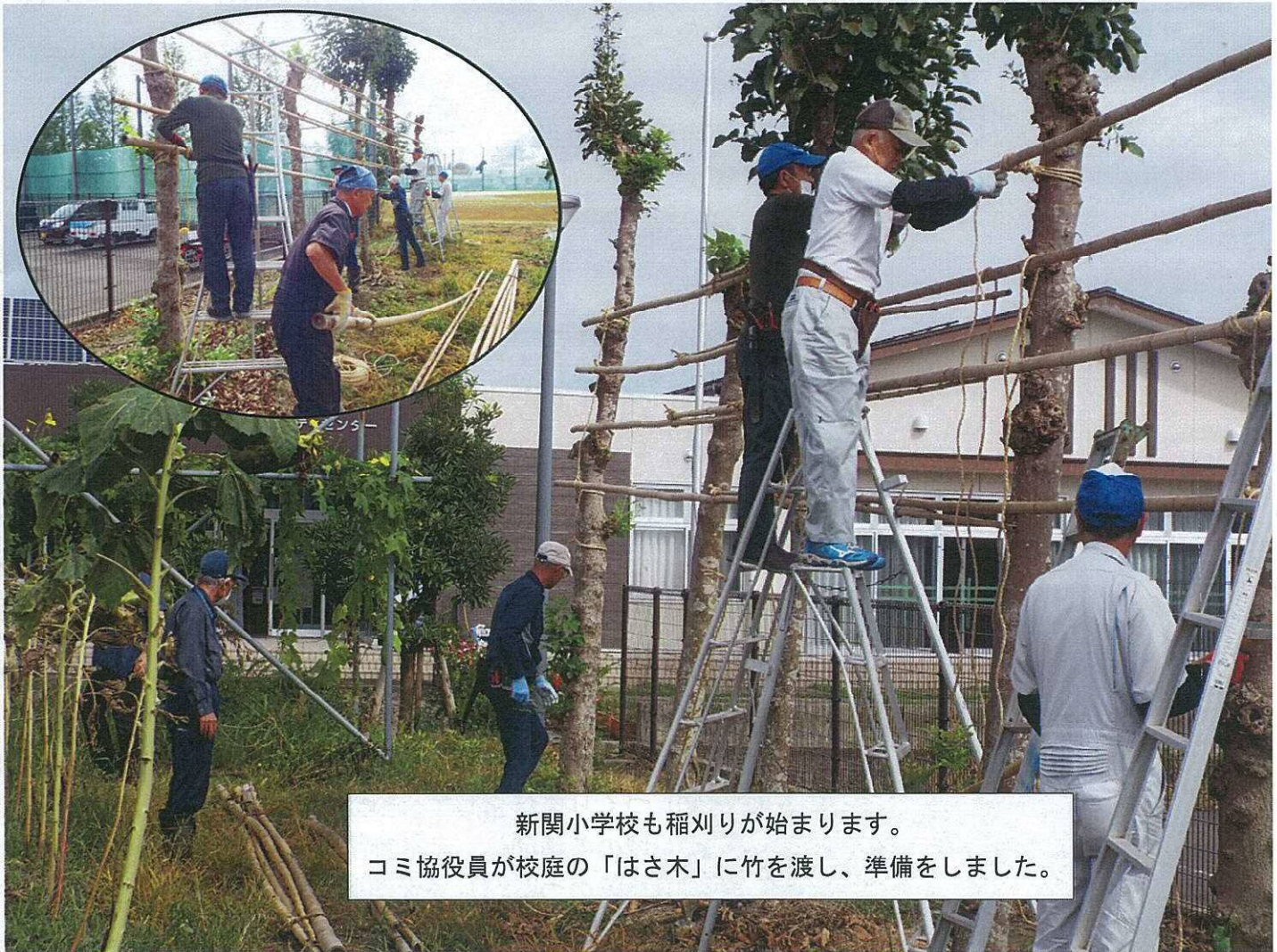
新関小学校も稲刈りが始まります。 コミ協役員が校庭の「はさ木」に竹を渡し、準備をしました。

残暑厳しい日が続きました 農家では実りの秋を迎え コンバインが重く垂れさがった稲穂を刈り取っていきます そして 瞬く間に黄金色のजूタンが消えていきます 豊作であってほしいと願いつつ 刈り取られた田を見ると一抹の淋しさもわいてきます