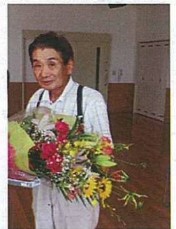
感謝状と花束を贈呈しました

気候の変化が例年より大きいようです。しかもコロナ禍の中、皆様お身体ご自愛ください。