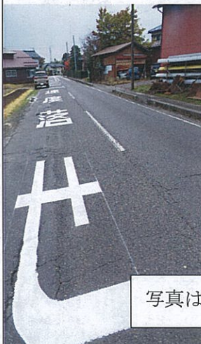
写真はお岡田地内

少し前になりますが、大関の新関駅近くの交差点に歩行者専用の信号が設置されました。地域の要望が実現され大変うれしく思います。