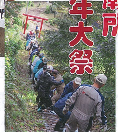
若宮御廟所の整備のため 住民一丸：頂上へ砂利運搬 (事前の作業風景)

11月3日、小口自治会では、若宮御廟所八百年大祭が行われました。 山頂（観音山）には、承久の乱で佐渡に配流された父順徳上皇を追慕し越後にたどり着いた若宮が願い叶わずこの地で自害されたといわれる日から八百年の歳月を偲んでの記念碑建立。