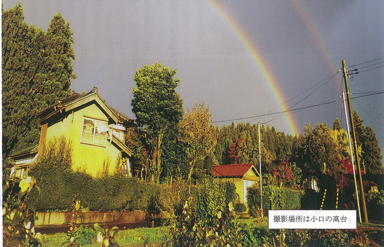
撮影場所は小口の高台