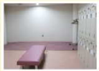
ロッカー (無料)、更衣室あり

アクセス 駐車場 普通車135台、大型車5台、障がい者用2台 区バス 金津・石油の里前下車 徒歩4分