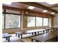
昔の休憩室で休めます