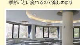
里山の景色を窓から楽しめる会議室 利用は無料です

里山ビジターセンター内には11羽の鳥が隠れているそう。お子さんと一緒に探して楽しんでみて♪