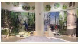
里山の景色の写真が皆さんをお迎え、季節ごとに変わるので楽しめます