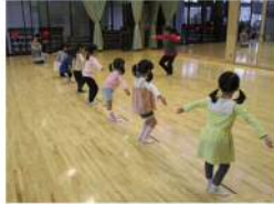
キッズバレエ教室