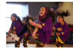
キッズダンス教室