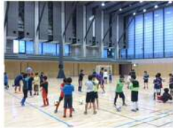
アルビレックス新潟によるキッズサッカースクール