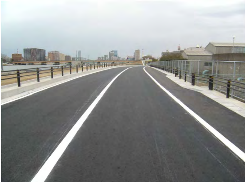
市道 信濃川右岸線