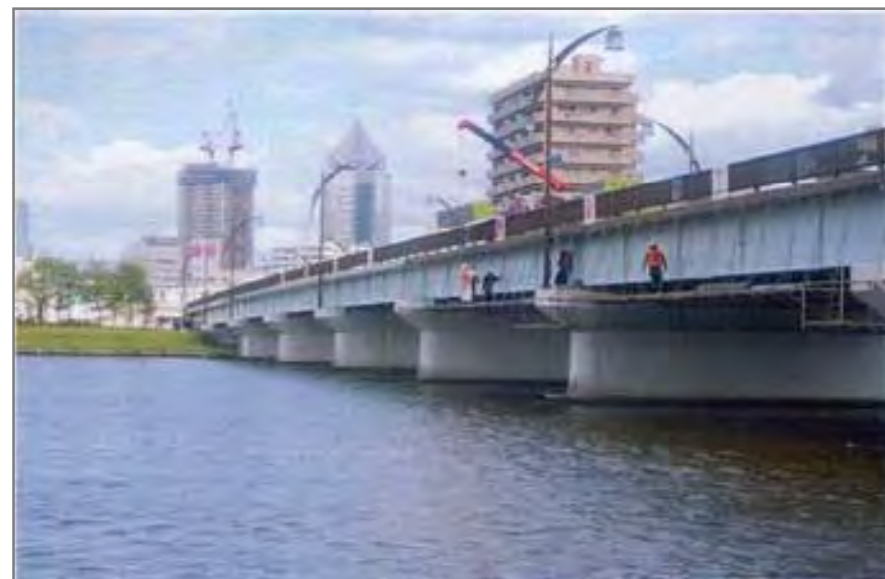
▲ 橋梁点検(八千代橋)