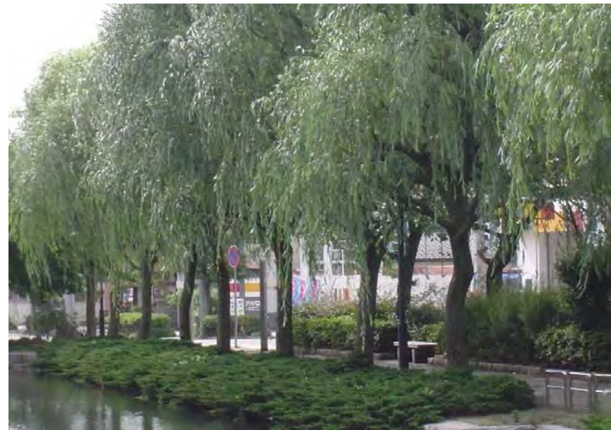
新潟市の木 ヤナギ