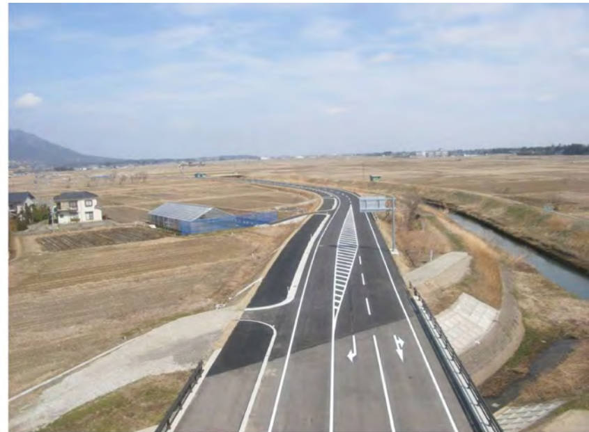
主要地方道新潟寺泊線（岩室バイパス）