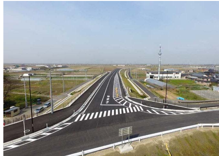
(主) 新潟中央環状線 (中ノ口工区)