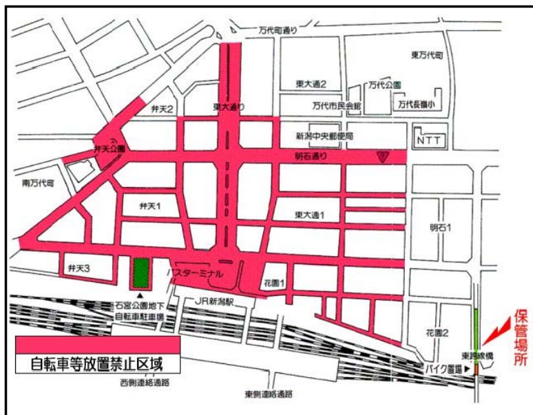
新潟市自転車等放置禁止区域（平成29年4月1日現在）