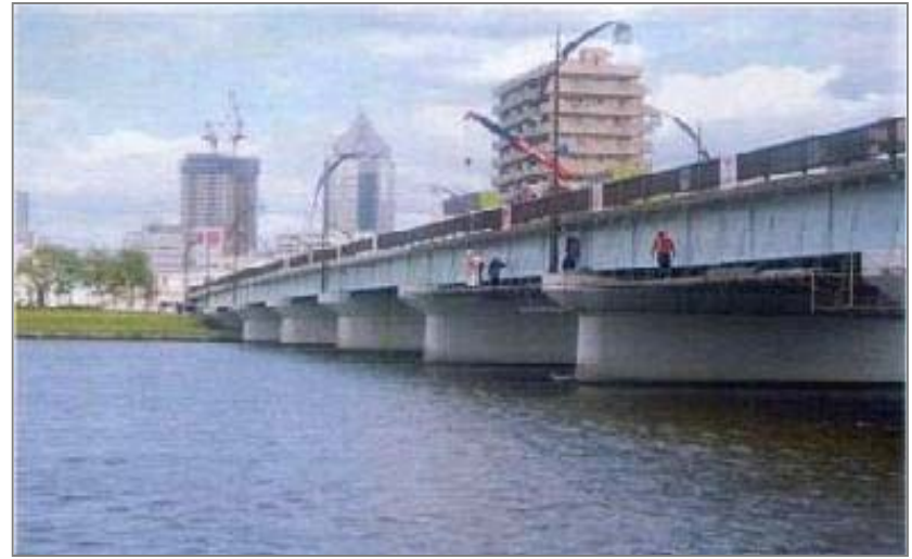
▲ 橋梁点検(八千代橋)