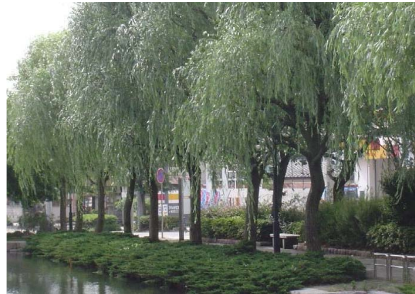
新潟市の木 ヤナギ