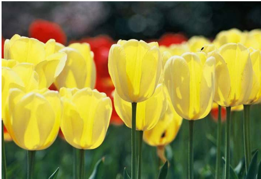
新潟市の花 チューリップ