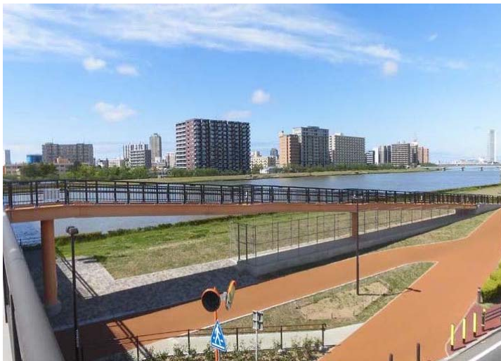
(一) 白山停車場女池線 (階段施設)