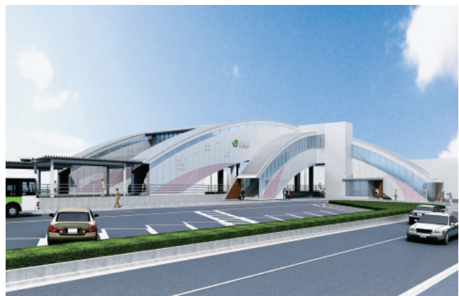
内野駅完成イメージ