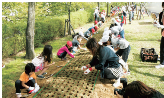
信濃川やすらぎ堤チューリップ植栽