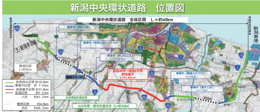
※この地図は、国土院発行の5万分の1地形図を使用したものである。