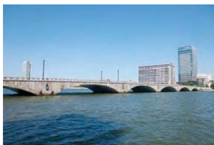
(本市を代表する景観 萬代橋と信濃川)

美しく個性的で魅力あるまちづくりを目指し、優れた景観を「まもり、そだて、つくり、つたえる」ため、景観法に基づく「新潟市景観計画」と「新潟市景観条例」、屋外広告物法に基づく「新潟市屋外広告物条例」を定め、総合的・計画的に景観形成を推進しています。さらに、市内各地域において、それぞれの歴史と文化を活かした「修景」や「きめ細かなルール作り」を市民・事業者と一体となって取り組んでいくことで、市民共通の資産である新潟らしい景観の形成に取り組んでいます。