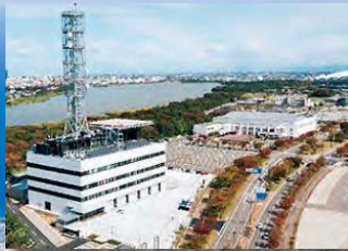
消防局・中央消防署

平成27年12月に、消防局・中央消防署の新庁舎が完成しました。(ウェルネスゾーン)