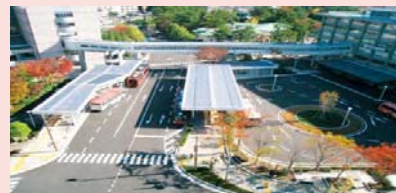
〔市役所ターミナル〕

上屋や防風壁を設置し、移動距離を極力少なくするなど、利用者の負担を軽減しています。