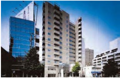
【寄居町地区 まちなか再生建築物等整備事業】

既成中心市街地である古町周辺地区に建築された築40年余りを経過した老朽マンションを建替え、優良住宅による都心居住の促進と公開空地による周辺環境の改善を図りました。