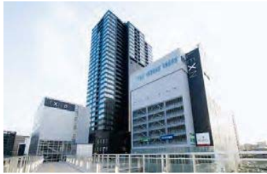
【新潟駅南口第二地区 第一種市街地再開発事業】

新潟市の陸の玄関口である新潟駅の南口において、広域交通拠点周辺地区としての立地条件を活かし、都心居住を目的とした住宅等を中心とする施設計画により事業を進めました。