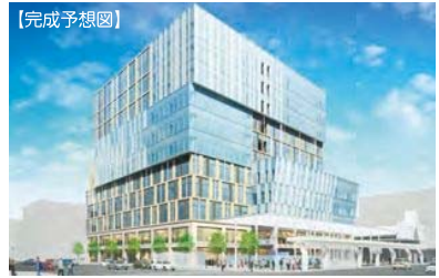
【古町通7番町地区 第一種市街地再開発事業】

かつて湊町新潟の中心として繁栄した古町地区において、そのシンボルであった旧百貨店建物と、隣接する周辺の建物とを一体的に不燃化、高度化すると共に、商業・業務・教育・行政など、様々な機能を集約することで賑わいの創出を実現し、古町周辺地区の活性化を図ることを目的に事業を進めています。