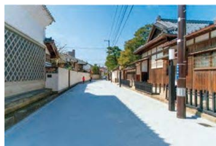
(景観計画特別区域 旧齋藤家別邸周辺地区)