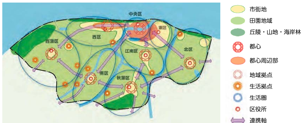
図 都市構造概念図

平成29年3月には、新潟市立地適正化計画を策定し、まちなかに望まれる都市機能や良好な居住環境の形成に向け、適正な土地利用を緩やかに誘導するための取組方針が示されています。