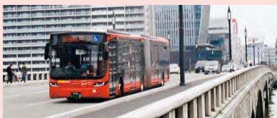
〔連節バス：愛称「ツインくる」〕

新潟駅前～青山間において、連節バス4台と一般バスを組み合わせで運行しています。今後も「基幹公共交通軸」の整備に向け段階的に取り組みます。