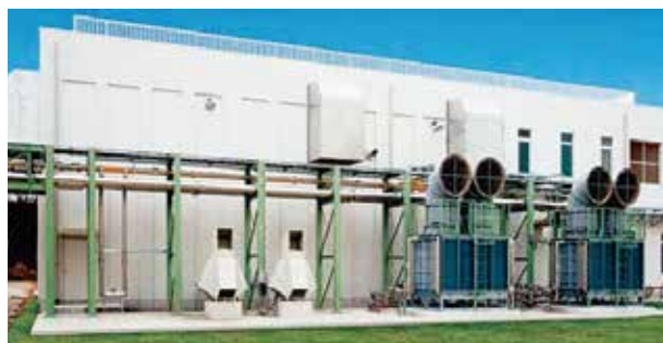
中部下水処理場に導入した消化ガス発電設備