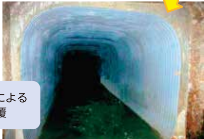
プラスチック材による 管渠内の内面被覆