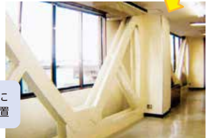
処理場管理本館に 鉄骨ブレース設置