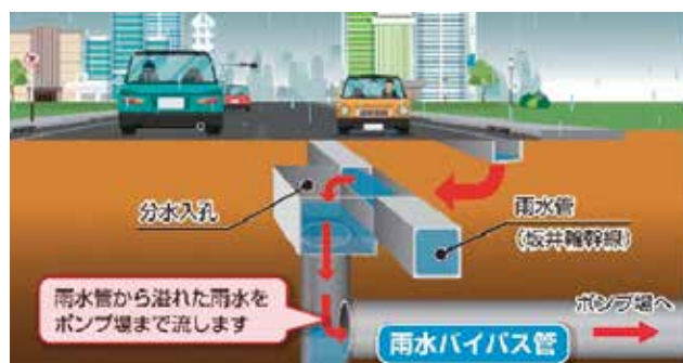
坂井輪雨水1号幹線