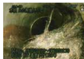
管内詰まり (木根侵入)