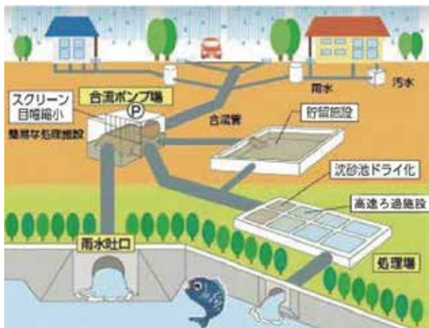
合流式下水道の改善イメージ