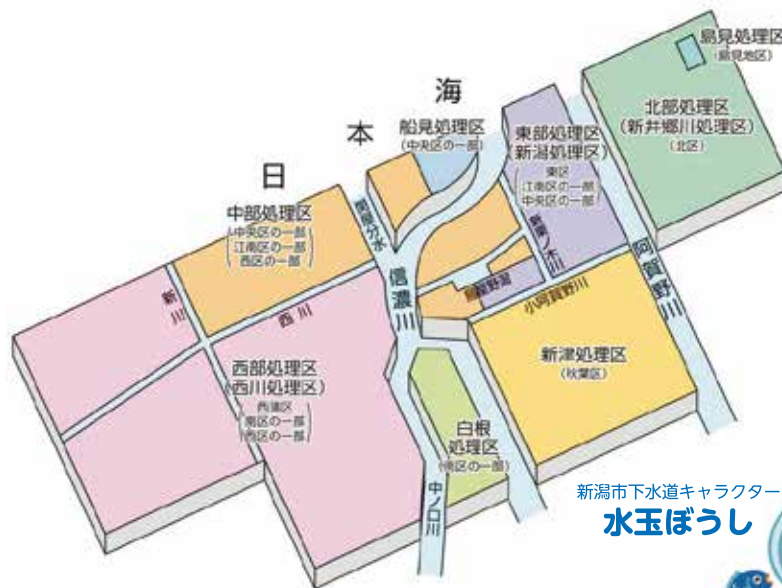
新潟市下水道キャラクター 水玉ぼうし