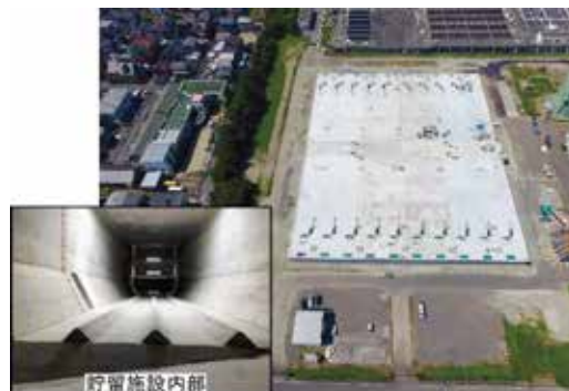
中部下水処理場 貯留施設