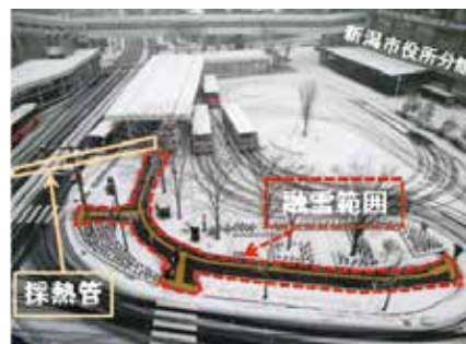
下水熱を利用した歩道融雪状況