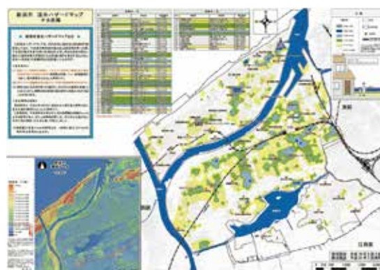
浸水ハザードマップ (中央区)