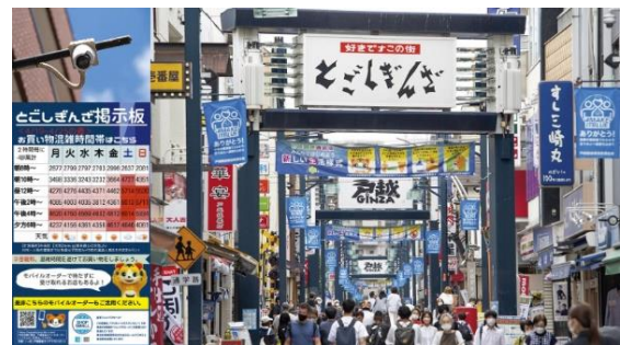
「電子回覧板とAI活用による人流分析」 (品川区商店街連合会/東京都品川区)

参考：株式会社全国商店街支援センター https://www.syoutengai-shien.com/