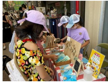
「千客万来 招き猫マルシェ 子ども商店街」 (せと末広町商店街振興組合/愛知県瀬戸市)