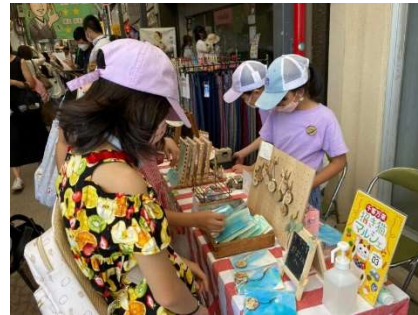
「千客万来 招き猫マルシェ 子ども商店街」 (せと末広町商店街振興組合/愛知県瀬戸市)