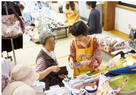
「出前商店街」 (にかほ出前商店街振興会/秋田県にかほ市)