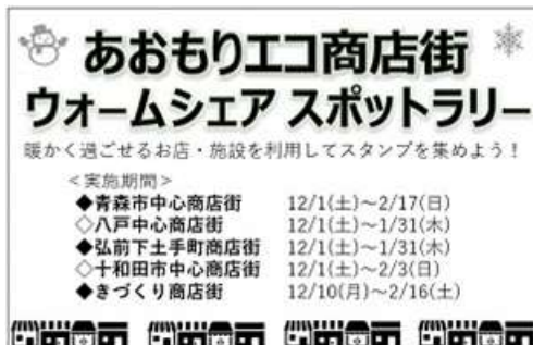
「ウォームシェアスポットラリー」 (青森市中心商店街, 八戸中心商店街他/青森県)