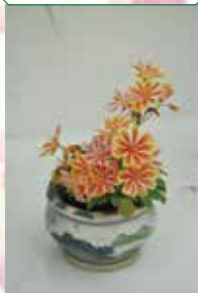
新潟山野草友の会