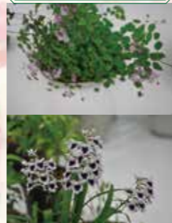
新潟山野草友の会