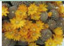
新潟サボテンクラブ