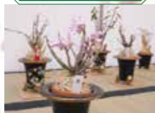
新潟県長生蘭同好会