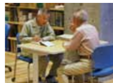
園芸相談コーナー 食育・花育センター1F