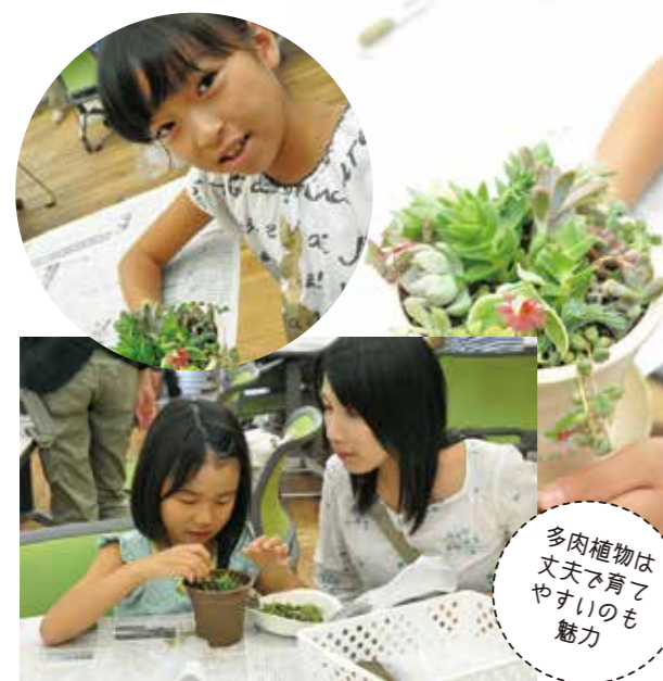
多肉植物は丈夫で育てやすいのも魅力

参加費500円 定員20組 自分流に鉢を飾りつけた後、たくさんの多肉植物を組み合わせて植えました。それぞれの葉の厚さや形・色の違いもあって楽しさも倍増。