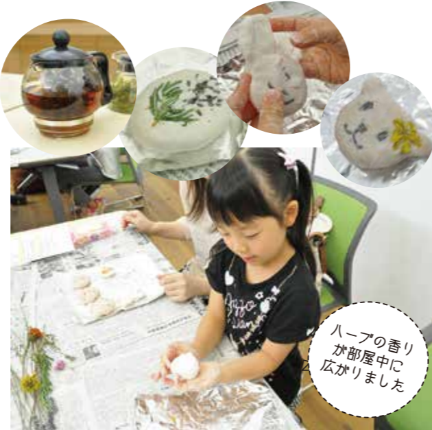
ハーブの香りが部屋中に広がりました

参加費1,000円 定員20組 ハーブの有効成分を熱湯で抽出し、石けんに練りこんで好きな形に整えます。ドライハーブで飾りつけをする時は、子どもたちの自由な才能があふれていました。