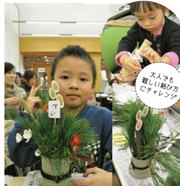
大人でも難しい結び方にチャレンジ

参加費1,000円(2個) 定員15組 自分で作った門松を飾るなんて、特別なお正月になったのではないのでしょうか。日本伝統のちょっと難しい飾り結びも練習しました。