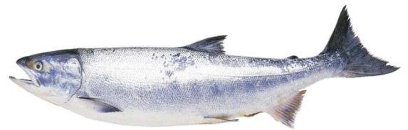
さけ・サーモン(大人になると80センチメートルくらい)