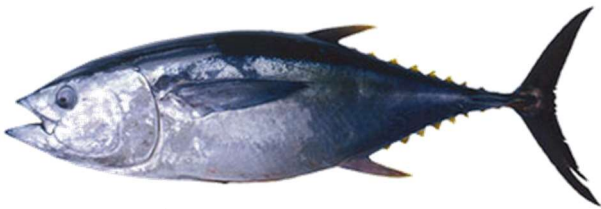
まぐろ(大人になると3メートルくらい)

お魚がおすし用の切り身になる前は、下のよう すがた な姿をしているよ。切り身の色と、切り身になる前のお魚の いろ 体の色はちがうことがわかるね。