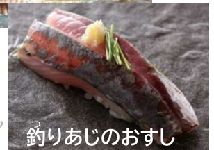
釣りあじのおすし