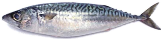
さば(大人になると50センチメートルくらい)