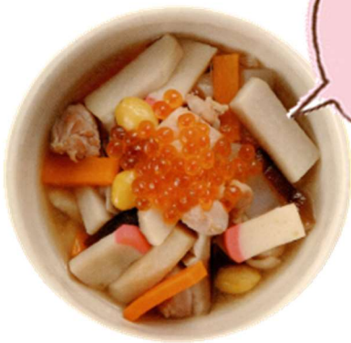
(新潟) 下越 (かえつ)

には、なくてはならない料理だね。でも実は、新潟県の中でも地域によって入れる具材や、呼び方が違うよ！みんなのお家ののっぺにはどんな具材が入っているかな？