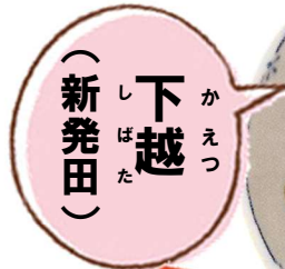
(新潟) 下越 (かえつ)