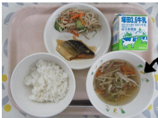
「ちよい塩うまみ給食」

「沢煮わん」はかつおぶしと煮干しのだし汁と、肉・やさい・きのこのなどの食材を使用した具沢山の汁物です。うまみたっぷりで食塩控えめでもおいしくいただけます。