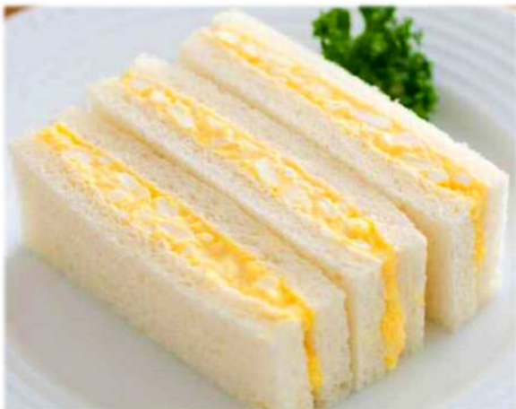
A ゆでたまごをマヨネーズとあえたものをはさんだサンドイッチ

サンドイッチで人気の「たまごサンド」。君は「たまごサンド」と聞いて、AとBのどちらを想像するかな?