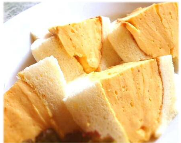
B ぶ厚く焼いたたまご焼きをはさんだサンドイッチ

新潟で生まれ育った人は、Aの写真のようなたまごサンドを想像する人が多いはずだ。でもね、大阪や京都で生まれ育った人は、「たまごサンド」といえばBの写真のようなサンドイッチを思い浮かべるんだって!