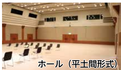
ホール (平土間形式)

新潟市民プラザは、講演会、音楽、演劇、展示会などさまざまなイベントの会場として利用できる施設です。用途に応じてステージの広さや客席数を変更できるホールと、絵画や写真などの作品を無料で発表できるミニギャラリーを備えています。