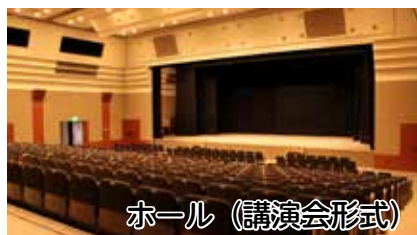
ホール (講演会形式)

開催予定のイベントは、NEXT21・1階のアトリウムで確認できるほか、ホームページ=二次元コード=にも掲載しています。ぜひご利用ください。