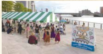
過去の開催時のようす