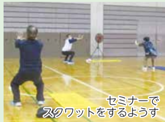
セミナーでスクワットをするようす

初期に自覚症状がない糖尿病。健診を受けた区在住者の約半数が血糖値の高い状態にあるという結果があります。 セミナーに参加して糖尿病予防をはじめませんか。 ☎9月22日、10月6日(いずれも木曜)午前9時40分～11時30分 📍クロスパルにいがた ☎中央区在住で運動制限のない18歳～74歳の先着15人 ☎あす22日(月)から9月5日(月)まで電話で健康福祉課健康増進係(☎223-7246)へ