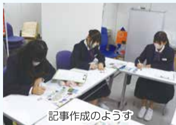
記事作成のようす

施設見学とインタビューを終え、取材した内容を記事にしていきます。どのような文章を書けばよいかイメージをつかむために、過去に刊行された区だよりを参考に、読み手の立場に立って分かりやすい文章を考えました。