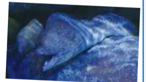
生徒が撮影した写真

小さな子どもから大人までヒトデや貝などの海の生き物を実際に触ったり、持ったりすることができます。ヒトデを触ってみると意外に硬くてザラザラしていました。触って体験できるという面白さも魅力の一つだと思います。