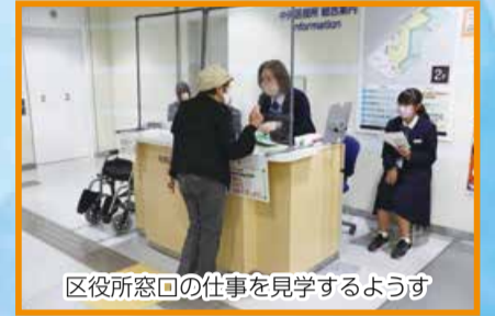
区役所窓口の仕事を見学するようす

10月4日・5日に、新潟柳都中学校2年生が総合学習で区役所の職場体験を行いました。3人の生徒たちが交通安全の街頭啓発やにいがた2kmイベントの準備作業、区役所窓口の見学、中央区だよりの作成業務など、さまざまな仕事を体験しました。