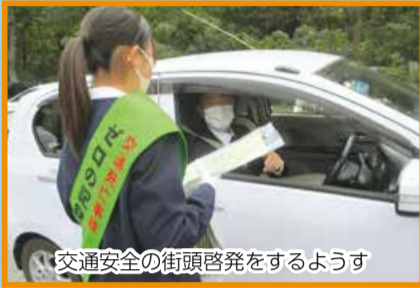
交通安全の街頭啓発をするようす

10月4日・5日に、新潟柳都中学校2年生が総合学習で区役所の職場体験を行いました。3人の生徒たちが交通安全の街頭啓発やにいがた2kmイベントの準備作業、区役所窓口の見学、中央区だよりの作成業務など、さまざまな仕事を体験しました。