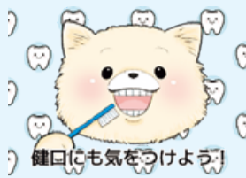
健康にも気をつけよう!