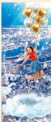
完成写真イメージ図