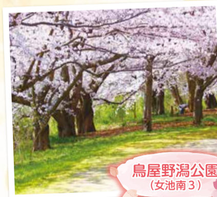
鳥屋野潟公園 (女池南3)