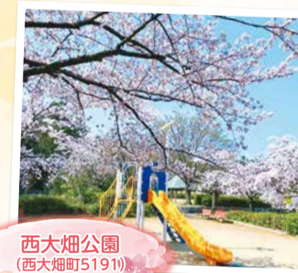
西大畑公園 (西大畑町5191)