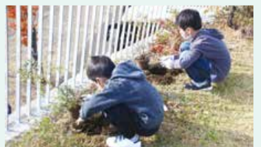
植樹する児童のようす

昨年11月11日に、鏡淵小学校2年生の児童が白山公園空中庭園でユキヤナギの植樹をしました。市開発公社の緑化活動の一環で、児童は春先から学校で育てた苗を公園に植え替えることを心待ちにしていました。児童は自分の木が高く大きく育つよう、□々に「自分の身長より」「他の植木より」「先生の身長より」「天まで」と将来に期待を膨らませていました。