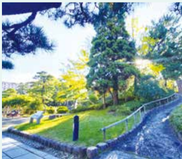
美幸岐賀丘に続く道