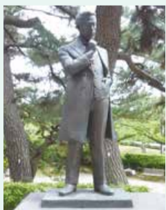
白山公園の創設者 楠本正隆像

また、公園の造りが今まで維持されており、学術上や鑑賞上の価値が高いことから平成30年10月に国の名勝に指定されました。