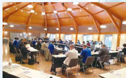
観光施設の天寿園で会議するようす

手探りな活動でも意見を出し合い支えてくれた委員の皆さま、関係職員の皆さま、そして区自治協議会の企画に参加いただいた地域の皆さま、これまでありがとうございました。