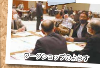
ワークショップのようす