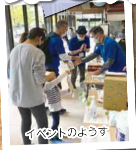
イベントのようす

令和3年4月より活動した第8期区自治協議会は、今年3月末で終了します。各部会の活動を振り返ります。