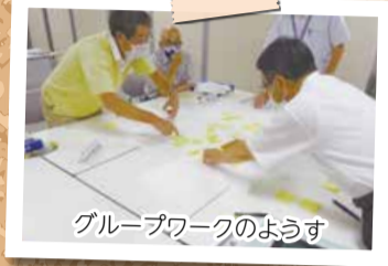
グループワークのようす