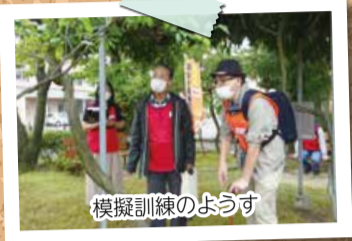
模擬訓練のようす