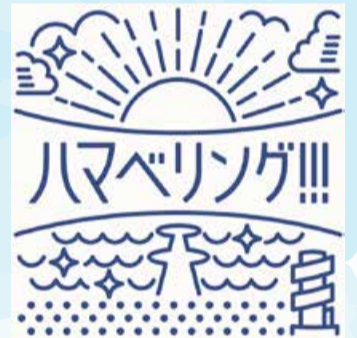
▲ロゴマークは商標登録中です

インパクトと認知しやすさを意識して作りしました。訪れたことのない人にも日如山浜の景色がイメージできるよう突堤や日如山展望台など特徴的な建造物を入れています。海や浜は美しい自然環境を、太陽は賑わいや明るい未来を表しています。