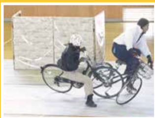
右の自転車が周囲を確認せず斜め横断したため発生した衝突事故

スタントマンが実際に事故が起こる様子を再現し、強烈な恐怖を感じることでより交通安全のルールを守り適切な行動をとるよう促す方法をいいます。