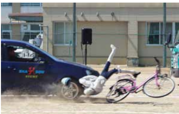
▲人形による衝突の再現

私たちは、時速40kmの自動車と自転車の衝突事故などの再現を見て、交通安全を学びました。