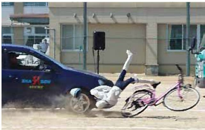
▲人形による衝突の再現

「スクアード・ストレイト」とは、スタントマンが交通事故を再現し、それを見て恐怖を感じることで交通安全の意識を高める教育技法のことです。5月10日、交通安全教室を上山中で開催し、1年生約300人が参加しました。生徒