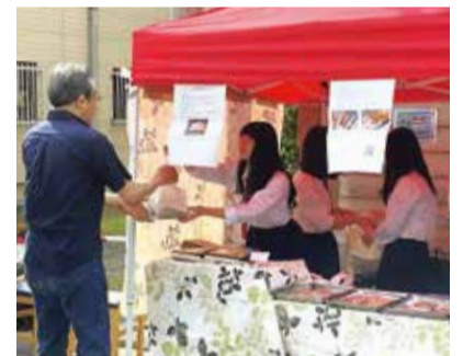
▲テイクアウトメニューの販売

学生たちは体験を通して、沼垂テラス商店街の朝市の来場者に沼垂へ何度も訪れてもらうことで、まちを盛り上げようと考えました。そこで、 開志専門職大学 はイラスト作成の分野をいかして地域のマスコットキャラクターづくりワークショップの開催や地域のお店紹介マンガと動画の制作、 新潟商業高校 はモノを売る分野をいかして朝市での焼き菓子と天丼の販売を実施。また、 新潟大学 の学生は沼垂を学ぶ中で、生活必需品を扱う店を増やしたり、お店の魅力を発信したりすべきと考え、朝市での服や本のリサイクルショップ運営と、お店のPRサイト作成を行いました。