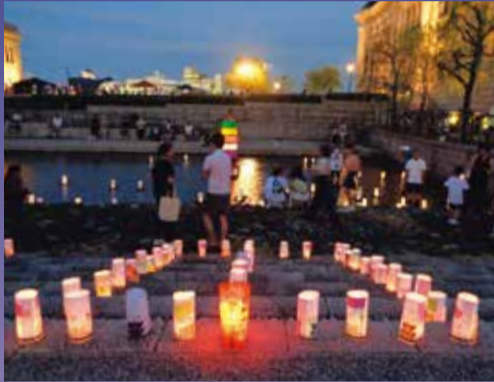
▲昨年の灯籠流しの様子