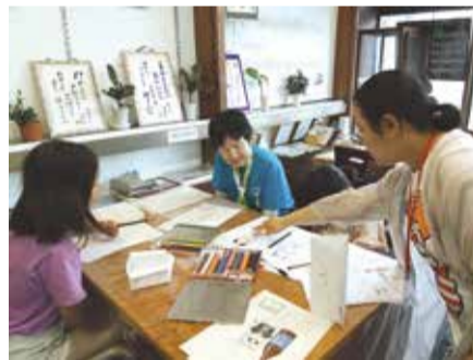
▲キャラクターデザイン制作体験ワークショップ