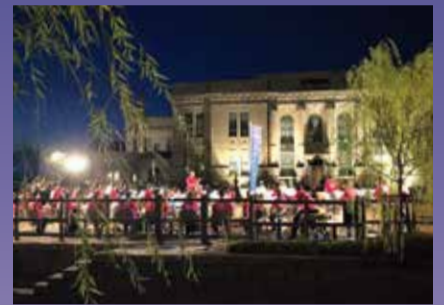
▲昨年のコンサートの様子