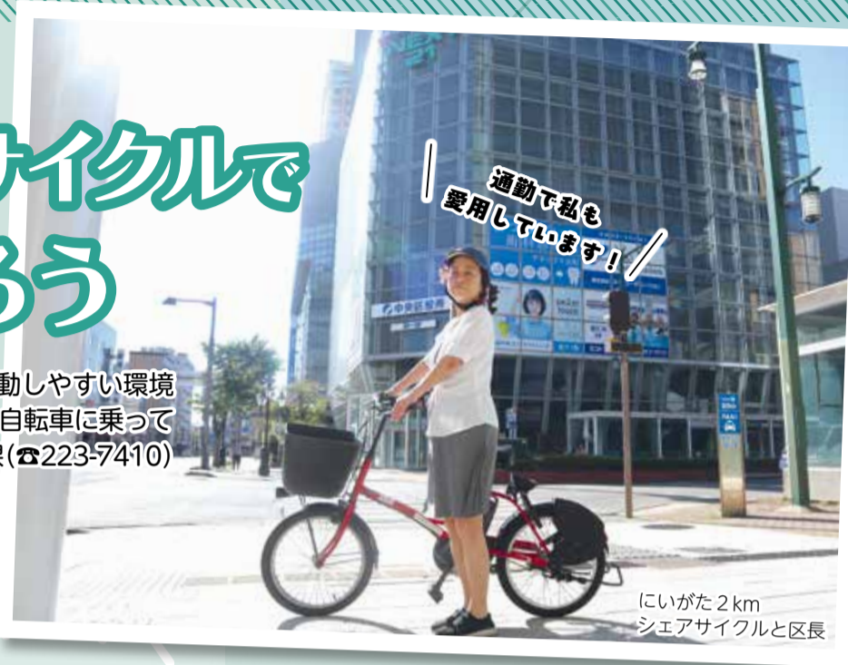
にいがた2km シェアサイクルと区長