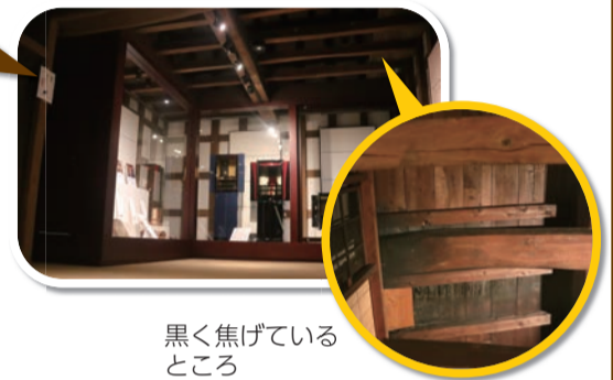
黒く焦がれているところ

道具蔵は館内で最も古い建物で、167年前に建てられました。多くの柱と太い梁があり耐震に優れています。見上げると2階東側にある窓の周りが黒く焦がれていて、これは明治13年の大火によるものと考えられています。現在道具蔵は企画展などの展示スペースとして使用しています。