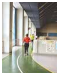
▲1周180mのランニングコース

代謝が落ちる冬は、ランニングやマシンを使用した有酸素運動がおすすめです。体力測定を受けた方に専用のトレーニングメニューをつくります!(要予約)