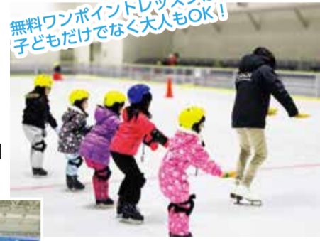
◀未就学児が遊べる、土日祝日限定のキッズパークは大人気

PTA行事など団体でも利用できます。初心者向けに氷上スポーツ教室も開催しています!