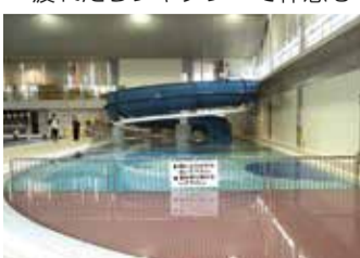
▲ウォータースライダー付きの幼児プール、深さは3段階!