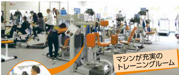
マシンが充実のトレーニングルーム

卓球やバドミントンができる大・中体育室の他、屋内プールやトレーニングルーム、柔・剣道場や弓道場もあり、さまざまなスポーツができる総合体育館です。