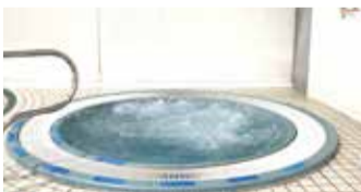
▲疲れたらジャクジーで休憩も

25mが14コースあり、しっかり泳ぎたい人向けの「スイムコース」やのんびり歩きたい人向けの「ウォーキングコース」などレーンが分かれていて、誰もが利用することができます。