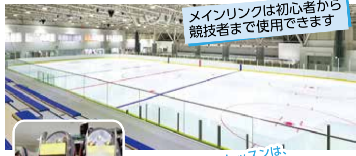
メインリンクは初心者から競技者まで使用できます

冬以外でもスケートやカーリングを楽しむことができます。全国的にも珍しい通年営業のリンクです。年中無休でいつでも楽しむことができます。