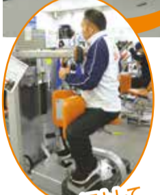
脇腹をツイストして引き締め!