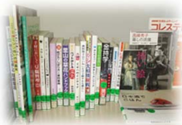
バラエティセット